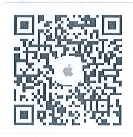
苹果客户端二维码