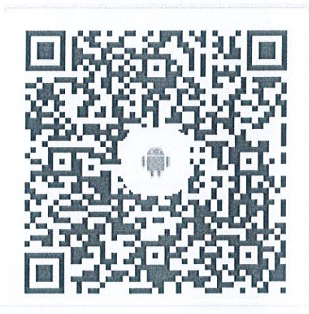
安卓客户端二维码